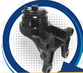
SOPORTE MOTOR IZQ DER MERCEDES BENZ 924