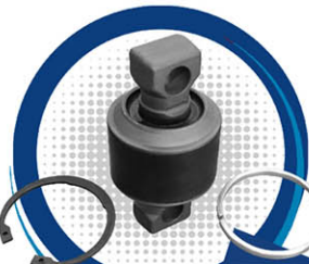
GRANADA PARA BARRA DE TORSIÓN MAN