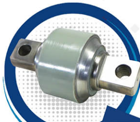
BUJE FRONTAL PARA BARRA ANGULAR AUTOBÚS