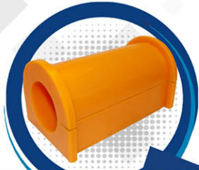
BUJE P-BARRA ESTAB SCANIA 92-93-113-142 OM904