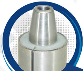
BUJE P TENSOR DE SUSP AUTOBÚS MERCEDES B