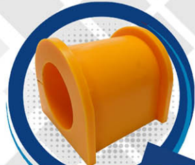
BUJE P-BARRA ESTABILIZADORA SCANIA K124