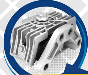
SOPORTE TRANSMISIÓN MERCEDES BENZ 906