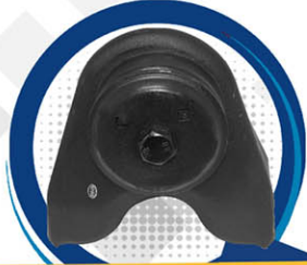
SOPORTE PARA MOTOR OM904