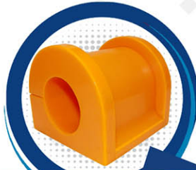
BUJE P-BARRA ESTAB SCANIA 92-93-113-142